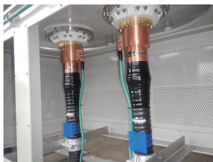
図4 終端接続箱組立状況

問合せ先：〒810-0004 福岡県福岡市中央区渡辺通3-6-11 (福岡富国生命ビル9階)