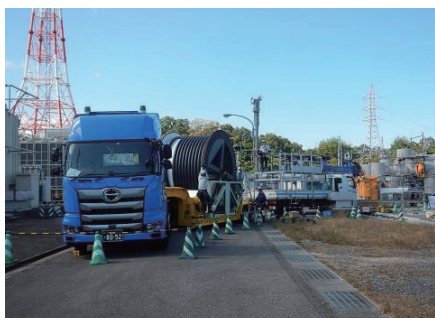
図1 ケーブル延線状況

ケーブル終端の接続作業では、スマート終端接続箱を採用する事が決まっていたので、ケーブルの引き戻しに必要な作業スペースをお客様と協議し、洞道内に事前に確保したことで、現地接続作業を効率良く実施することができました。