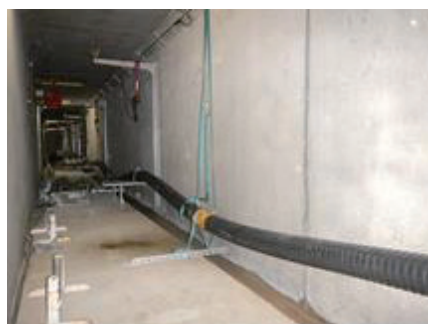
図2 ケーブル延線状況