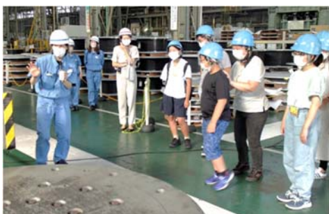
工場見学 = 相模原事業所