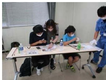
モーターの工作体験 = 三重事業所