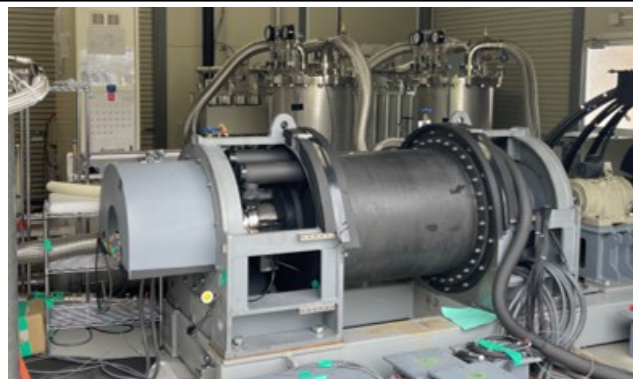
400kW 級全超電導同期モータ