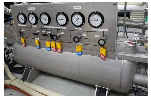
熱交換器ユニット