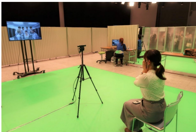
< 図 2 : 来場したファンの撮影の様子 >