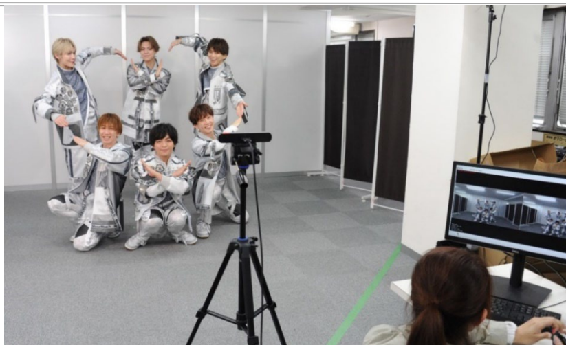
< 図 1 : 事前撮影する MeseMoa. のメンバー >