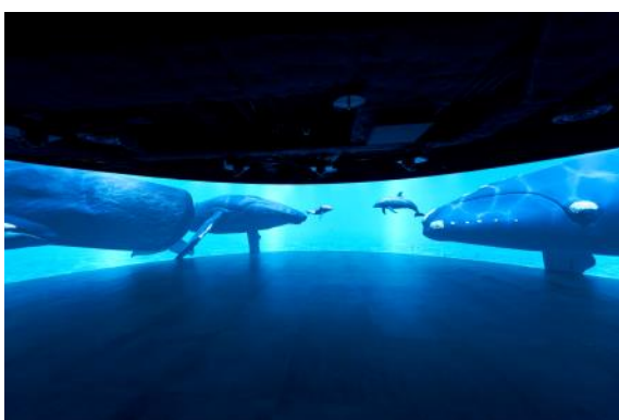
(パノラマスクリーンゾーン)