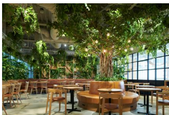
(こもれば 카페 Sweets & Cafe)