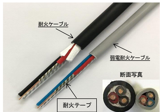
耐火ケーブル:1.2mm×3心 弱電耐火ケーブル:1.2mm×3心