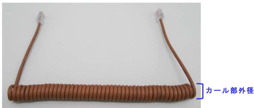
スーパーカール™ (茶)